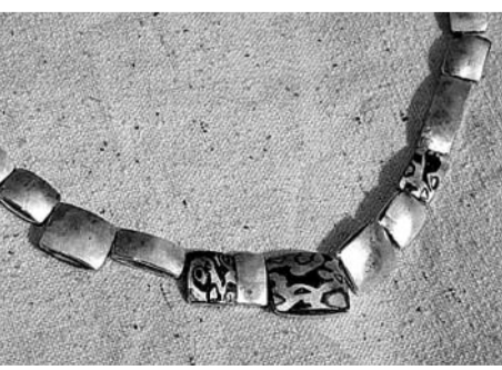
Giulia Taragnoli gioielli