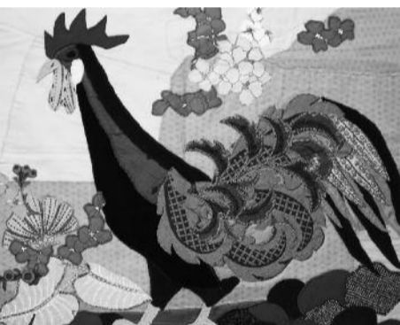
Renata Crippa tableaux chiffons