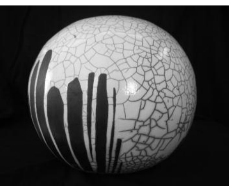
Tania Gandolfi ceramica